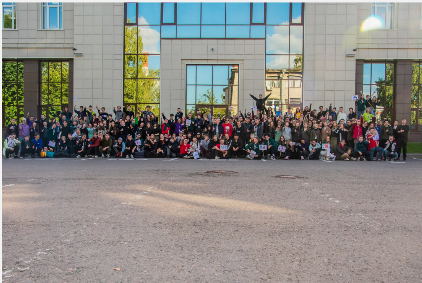
Посвящение первокурсников ИММиТ 2022