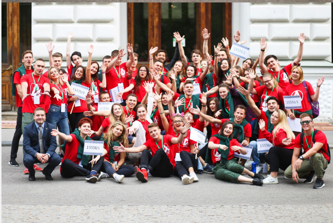
Адаптеры ИММИТ (2015-2018)

Адаптеры ИММИТ действовали уже много лет по отработанным схемам. С ОИ были общие точки соприкосновения на общих собраниях. Когда появилось весеннее