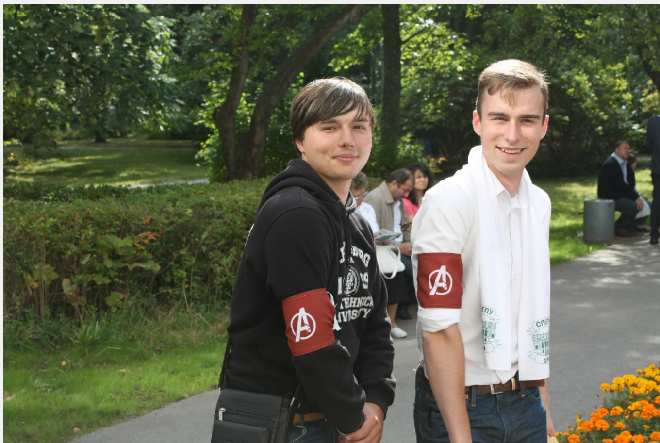
Красные повязки адаптеров ИММиТ (2013)

После толстовок, на следующий год, финансирование не удалось получить. Мы сделали красные повязки на плечо с буквой «А» в стилистике логотипа Мстителей. На красный цвет выбор пал, потому что это самый простой способ заметить человека из толпы.