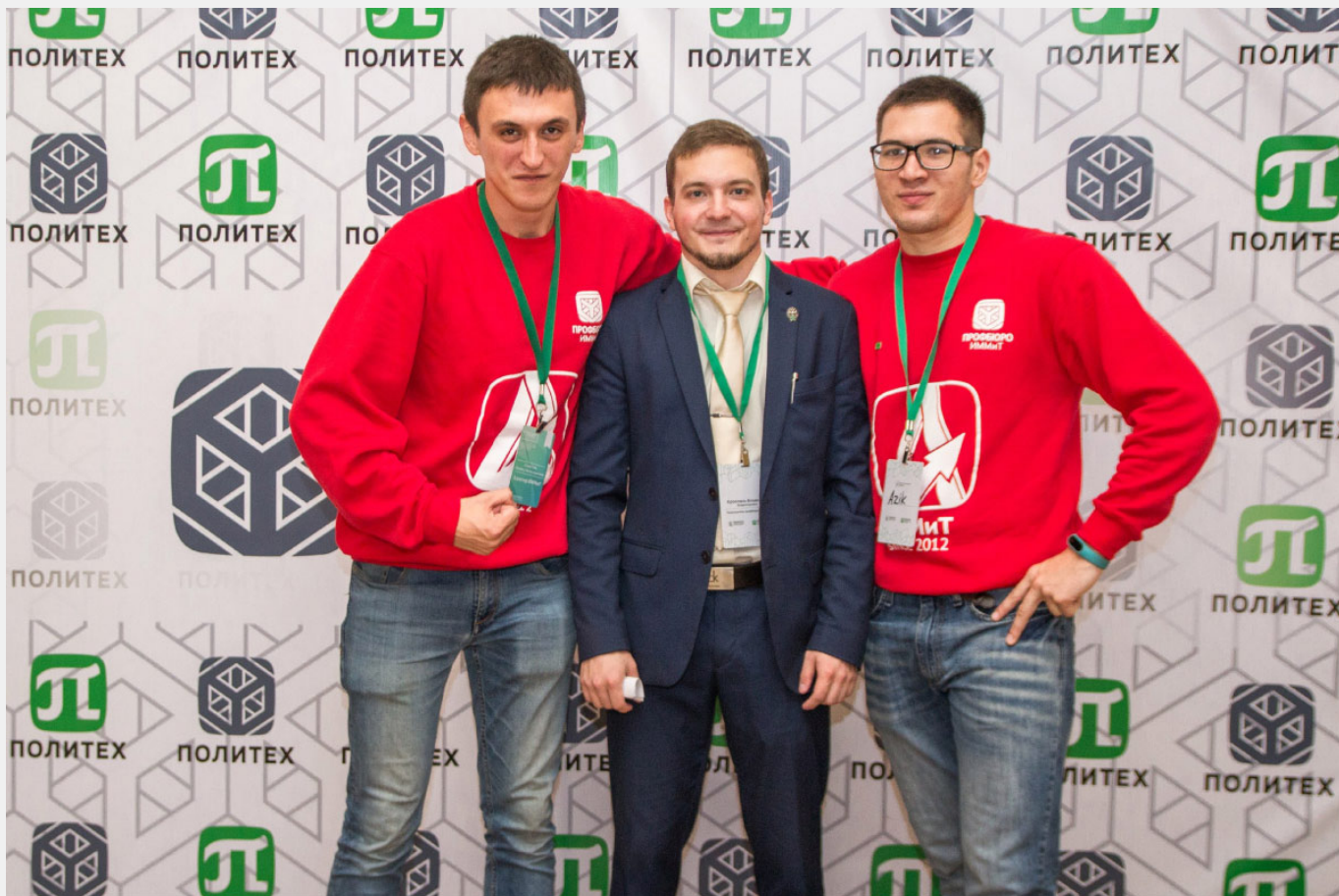
Футболки адаптеров и свитшоты кураторов ИММиТ (2017)