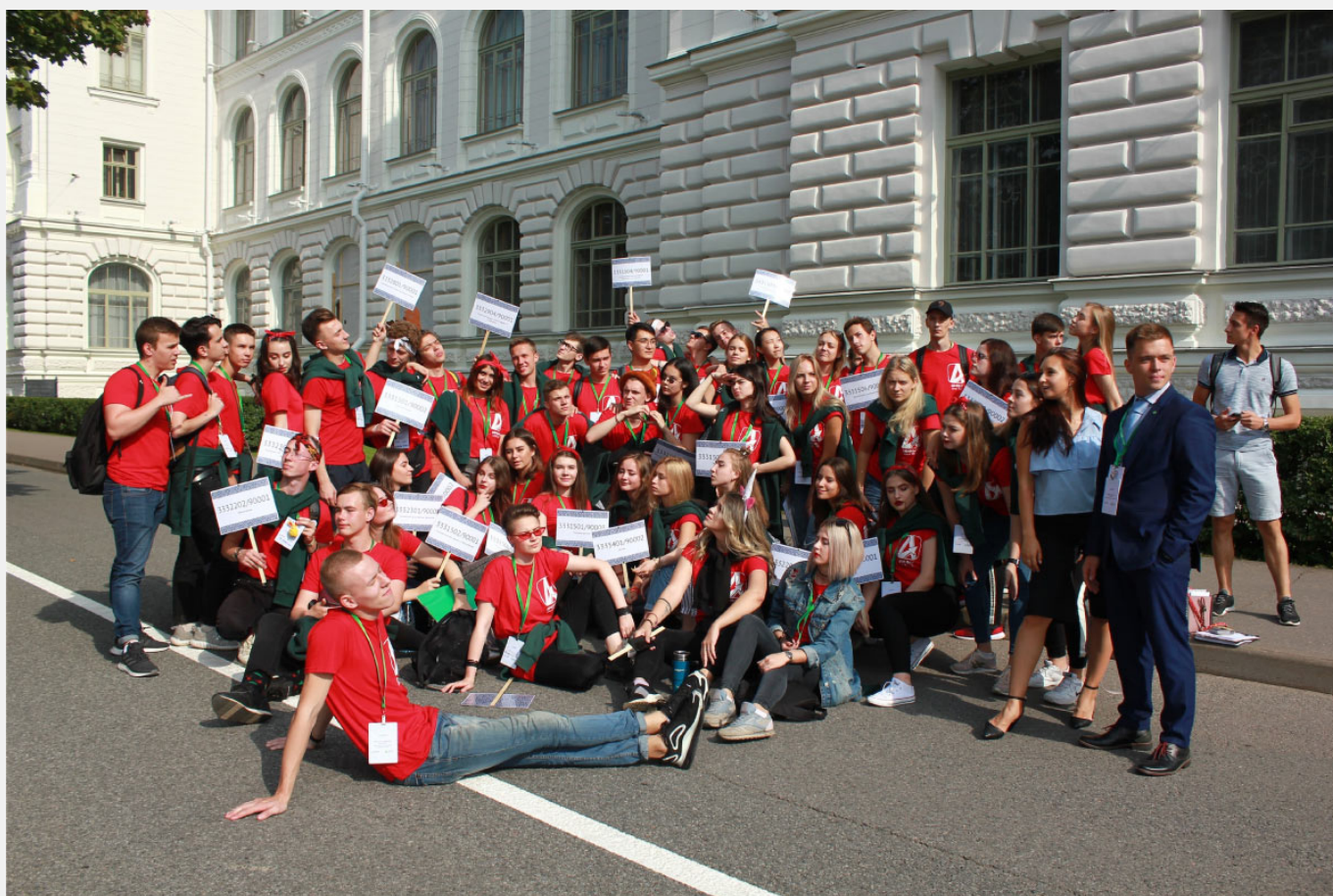
Адаптеры ИММИТ 2019

Для начала - ввели второй этап отбора, потому что поняли, что одного собеседования недостаточно. Второй этап на тот момент состоял из проведения тренингов. Убрали кураторов, так как, кроме как в сентябре, не знали, куда их можно привлечь. Не было ещё таких мероприятий, где студенты проявляли себя как кураторы. Случились первые шаги в ныне существующее тренерство. На обучение нового набора стали привлекать больше "старичков" адаптеров для связи поколений. Они делились своим опытом, общались, проводили тренинги. Я сделал упор на весеннее обучение, стало обязательным посещение весеннего обучения от ОИ. Одним из самых важных моментов стало то, что я разделил свои обязанности руководства адаптерами с другим человеком. Тогда посчитал разделять эти две обязанности, делегировать обязанности, как это было на других институтах. Но решил не отпускать, чтобы они не были "самоправны". Я не хотел, чтобы потерялась связь между адаптерами и профбюро.