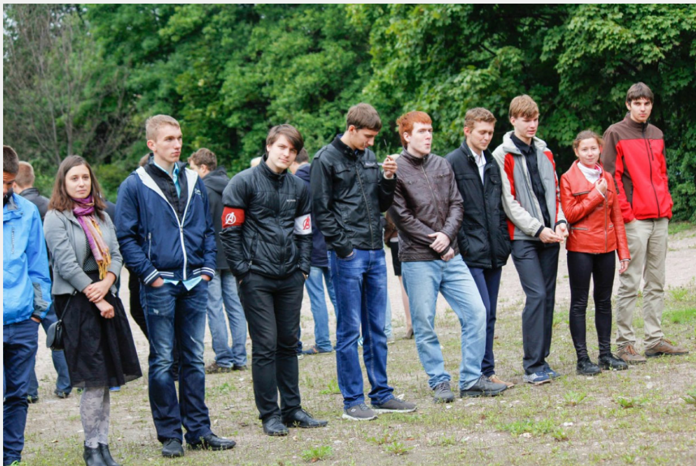
Белые повязки адаптеров ИММиТ (2014)