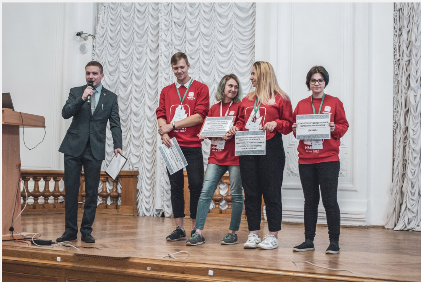
Футболки адаптеров и свитшоты кураторов ИММИТ (2018)

Ты был руководителем адаптеров 2014-2018 год? Случились ли за эти годы глобальные перемены, ведь это довольно длинный срок?