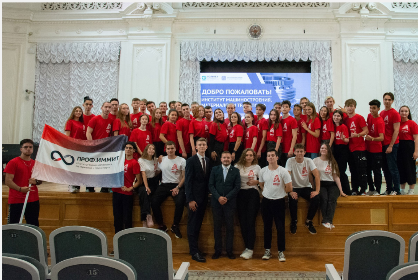
Адаптеры ИММИТ 2022 (юбилейный набор)

За 10 лет существования Адаптеров ИММИТ более 500 студентов были адаптерами, которые встретили более 5000 первокурсников.