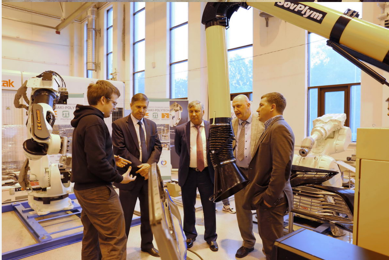
После переговоров делегация посетила лабораторию «Легкие и надежные и